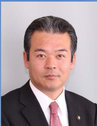
企業長 金坂昌典 (大網白里市長)

山武郡市広域水道企業団は、東金市、山武市、大網白里市、九十九里町及び横芝光町の3市2町が共同して、水道事業の経営に関する事務を処理する特別地方公共団体（一部事務組合）です。採用された職員は地方公務員となります。